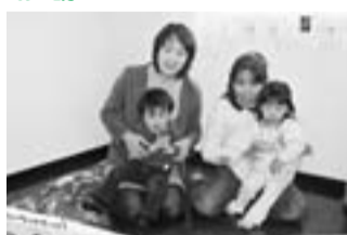
絵本のよみかかせの様子

主な会場 成瀬中央集会所 活動内容 地域の子育て中のお母さん同士や子どもたちとの親睦を図ることを目的としています。お茶やおしゃべりを楽しみながら、交流を深めています。 開催日時 月1回(5月は10日(水)、6月は7日(水)に開催) 午前10時30分～正午 参加費 100円 お誘い 昼間は子どもと二人っきりで家の中…そんなママはいませんか? わんぱくキッズは地域の子育てママ同士が交流しながら、楽しく子育てするための応援サークル。参加してくれる親子に喜ばれて4年目を迎えました。読み聞かせは大人気! 毎回色々な絵本や紙芝居が出てきて子どもたちは大喜び。その他、歌・手遊び・体操等、内容は盛りだくさん! ぜひ一度、遊びに来て下さいね!