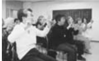
チェアーエクササイズの様子

主な会場 つくし野センター(つくし野2-26-5) 活動内容 人との出会いを大切に、体操や歌、ゲーム等で楽しい時間を過ごしています。心豊かな生活が送れるよう季節に合ったお菓子やお茶を楽しみながら、交流を深めています。 開催日時 月1回(5月は15日(月)、6月は19日(月)に開催) 毎月第三日曜日午後1時30分～3時30分 参加費 300円 お誘い 「年老いても、住み慣れた地域で親しい人々に囲まれ、楽しく生きていきたい」という志を持つ仲間が「共に生きる会・つくしの」を発足してから5年が経ちました。サロンは、その活動の一環で年令・男女を問わず気軽に集い、楽しい一時を過ごそうと心を込めてお待ちしております。活動も55回を重ね地域に根付いて来た様です。サロンの詳細は、つくし野生活情報サイト「ふれあいネット・つくし野」を検索してください。素敵なホームページで紹介しております。