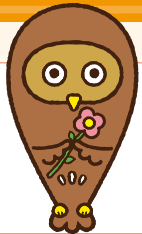
東京都福祉人材センターキャラクター「フクシロウ」