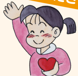
町田市社会福祉協議会イメージキャラクター「あいちゃん」