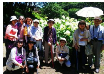
参加者15名のアジサイ鑑賞会 活動者や利用者の絆が深まります。