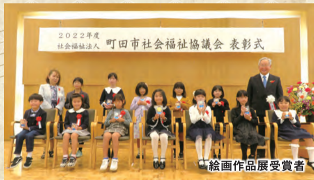
絵画作品展受賞者