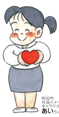
町田市 社会福祉 イメージ キャラクター あいちゃん