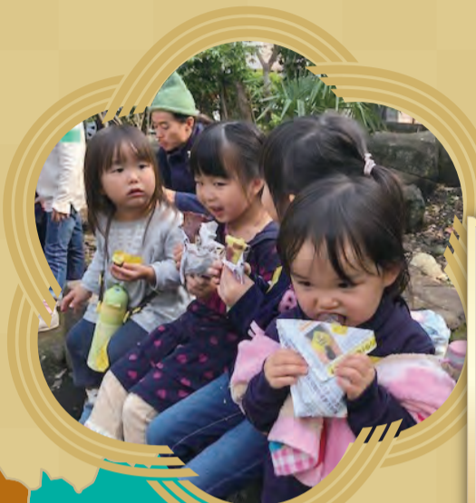
親子でヤキイモプロジェクト