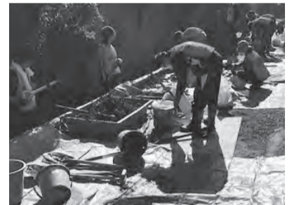
土砂・がれき撤去の様子

台風19号による復興支援のため、本会各窓口での募金箱設置、町田駅周辺での街頭募金実施、本会窓口への寄附受付により、11月14日時点で 合計86,528円 のご寄附をいただきました。皆様の温かいご協力ありがとうございました。