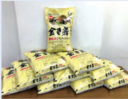
12月にお米100kgが届き、おうちでごはん事業の利用世帯を始め、市内10ヶ所の子ども食堂に提供しました。