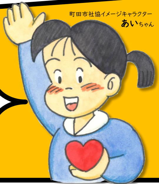
町田市社協イメージキャラクター あいちゃん