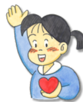
社協イメージキャラクター あいちゃん